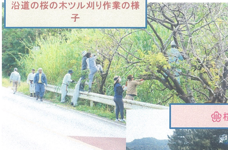
沿道の桜の木ツル刈り作業の様子