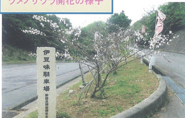
クメノサクラ開花の様子