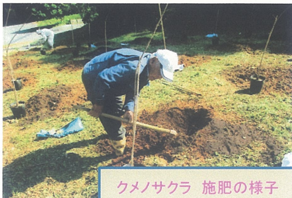
クメノサクラ 施肥の様子