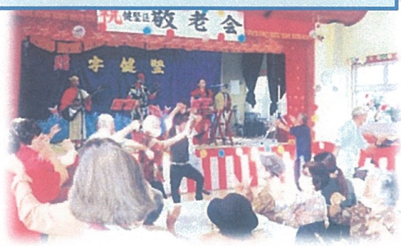
地域の敬老を祝う祝賀会の開催