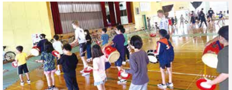
エイサーをレクチャーする瀬底小学校の生徒たち