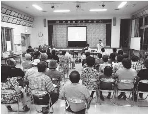
▲住民説明会の様子

子どもたちが町内の産業や仕事に興味を持ち、自ら考えることを促すことで、就業意識の向上につながることを目的に11月17日、本部中学校1年生によるジョブシャドウイング(主催・本部中学校、協力・本部町グッツジョブ連携協議会)が行われました。ジョブシャドウイングとは働く大人の後ろを影のようについてまわり、働く様子を間近で観察する