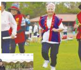
▲応援を背に受けゴールを目指す