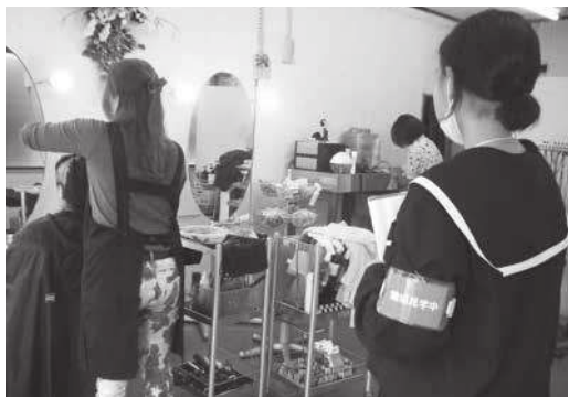
▲美容師さんのお仕事を観察中

活動のことです。町内36の企業や団体の協力のもと、実際に様々な場所でジョブシャドウイングを体験した生徒たちは「忙しい中でも仕事をテキパキこなしていた」「お客様に喜んでもらうため接客も工夫していることを知った」「働く大人はかっこいいと思った」など、働く大人を観察して自身の将来像を膨らませる貴重な体験となりました。