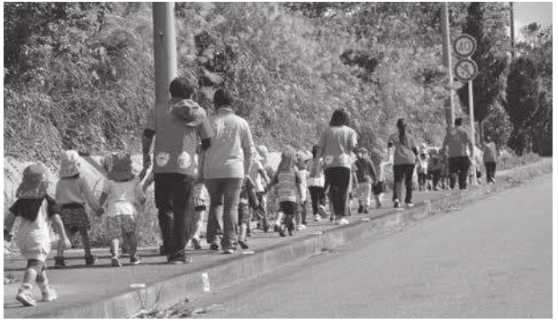
▲列になって急ぎ足で高台を目指すゆい保育園の園児と職員

「津波防災の日」の11月5日、沖縄県全域に強い揺れを観測し、大津波警報が発表されたことを想定した県下一斉の避難訓練が行われました。本部町では、学校や各行政区、宿泊施設のほか、大型観光施設など26団体1175名が訓練に参加しました。ゆい保育園では、役場の防災無線から大津波警報が発令されたことを告げる放送が行われると、職員が園児を集め、迅速に高台を目指し避難を行っていました。訓練の参加者からは「3回目の訓練なのでスムーズに避難できた」といった声がある一方、「避難経路に草が生い茂り、訓練を途中で断念した」といった課題も指摘されました。