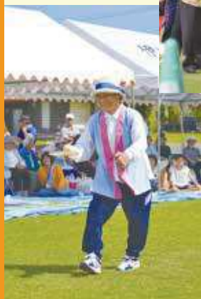
◀バドミントンのラケットからボールを落とさず走るスプーンレース。思わず「ありあり」と声が出た