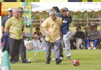
▲高良町長の真剣な表情に会場から笑い声が上がったラグビーボール蹴り競争