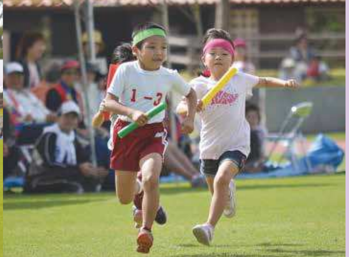
▲第11回もとぶ元気村親睦グラウンドゴルフ大会(写真上)と第39回本部町老人スポーツ大会に参加した子どもたち(写真下)