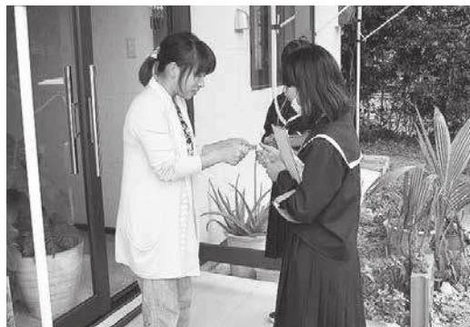
▲初めての名刺交換に緊張気味

本町では、平成18年度に5種類分別がスタートした後もごみの排出量が増加しており、その処理費用や処理施設の延命化対策などが大きな課題となっています。こうしたごみ問題に対応するため、10月20日から11月10日の間、各行政区でごみ減量化に向けた住民説明会を実施しました。説明会では、本町のごみ処理の現状や他市町村の動向、減量化の事例紹介のほか、有料指定袋や粗大ごみ処理券の導入など、今後のごみ処理施策についての説明を行いました。これから、ごみの減量化に向けた具体的な施策を進めていきます。