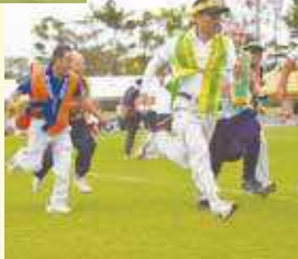
▲各字の意地がぶつかり合った200メートルリレー