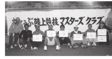
◆大会を終え笑顔の「むとぅぶマスターズクラブ」のメンバー