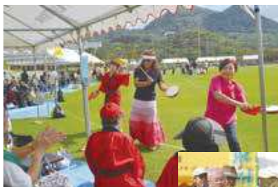
▲応援団も全力で応援!

老人の健康増進と地域間の交流を深めることを目的に11月2日、町運動公園において老人スポーツ大会(主催・町、町老人クラブ連合会)が開催されました。大会プログラムは、短距離(50メートル走)、玉入れ、ラグビーボール蹴り競争やパン食い競争など、子どもも老人も楽しめる競技で構成され、参加した18団体の各チームからは、大太鼓や棒術による応援や歓声が飛び交い、大いに盛り上がっていました。参加者らは、はつらつとした笑顔と年齢を感じさせない身のこなしで、大会を楽しんでいました。