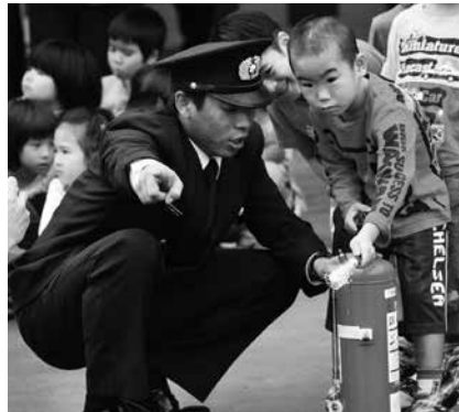
▲消火器の取扱い体験！