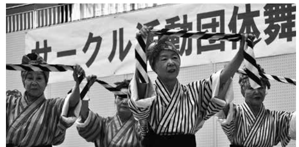
▲サークル団体発表

10日には琉球歌留多大会も行われ、町内の児童生徒やその保護者ら約50人が参加しました。読み手が琉歌の上の句を詠むと、それに続く下の句を取り合う琉球歌留多。会場には「とうたん（取ったぞ）」という掛け声が響きわたりました。