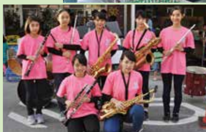
▲本部中吹奏楽部のみなさん