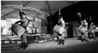
▲もとぶ八重桜花団