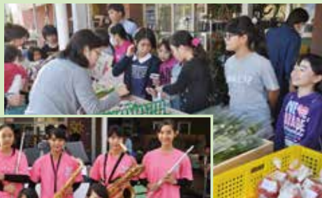
▲子ども会が販売体験!

もとぶ元気夕市では、活動をPRしたいサークルや団体などを募集しています。お申し込み・お問い合わせは、本部町の農業を元気にするネットワークの会事務局(町産業振興課内)TEL・47・2412まで。