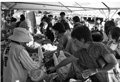
▲多くの人で賑わった朝市(平成14年頃)

ご意見・ご要望は新里コミュニティセンター(午前中のみ)TEL・48・2312まで