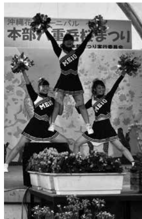
▲名桜大チアリーディング部

ご協賛いただきありがとうございます。大盛況に終わりました第39回もとぶ八重岳桜まつりへ町内外から多数のご協賛をいただき誠にありがとうございました。