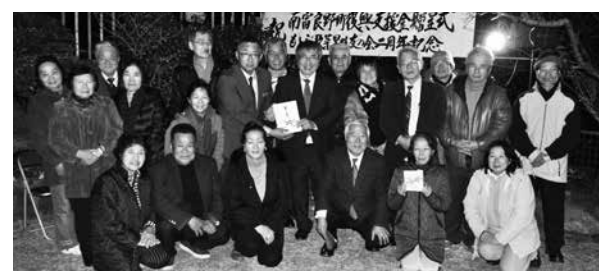
▲高橋副町長(中央左)に義援金を手渡す小浜会長(中央右)