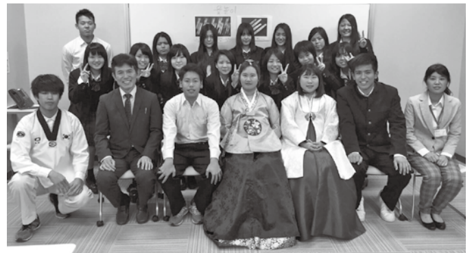
▲交流会を終えて笑顔で記念撮影