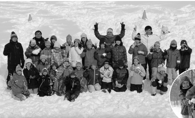
▲スキーや犬ぞり体験に大興奮！

本部町親善交流団21人(児童16人、随員5人)が1月30日～2月3日、本町の「友好の町」である南富良野町において冬の北海道を体験しました。 今年で26回目を迎える本事業は、「もとぶまちづくり担い手育成事業」の一環として、次世代を担う児童の健全育成を目的に実施しており、これまでに本町から約400人の児童生徒が参加し、気候や文化など多くの面で異なる両町の交流を深めてきました。 交流団は、南富良野町の皆様にあたたかい歓迎のもと、地元小学