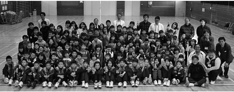
▲南富良野小学校で交流会