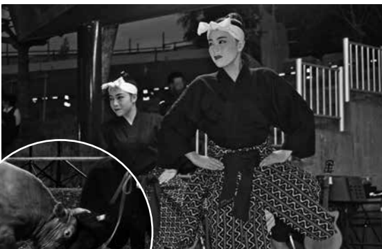
▲島唄みなみの舞踊

もとぶ観光文化フェスタは、来年度以降も開催予定です。みなさんも是非足を運んで、ナイター闘牛やピージャーオーラサイを楽しんでみませんか？