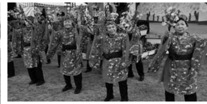
▲民謡サークル本部