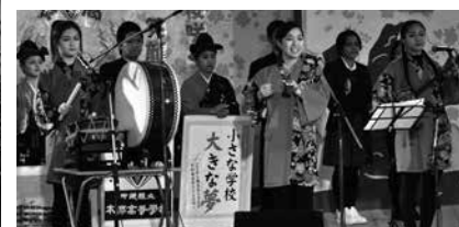
▲本部高校桜の森舞台祭

期間中の土日に八重岳桜の森公園に設けられたステージを中心に、石くぶり大会やカラオケ大会、キャラクターショーなど多彩なイベントが行われました。まつりの期間中、国内外から15万6千人の来場があり、天気の良い日は平日であっても多くの花見客でにぎわい、子どもから大人まで多くの人が桜を楽しみました。