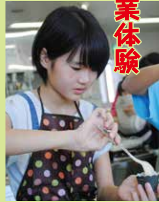
▲マフィン作りに挑戦！うまくできたかな？