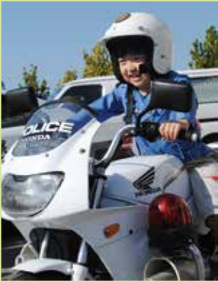
▲白バイ乗車体験！カッコいい！

ナース体験をした女子児童は「はじめて心臓の音を聞いたり、脈を測れてよかった」とうれしそうに語りました。また保護者からは「業種によつては大人でもわからないことがたくさんある。また機会があれば子供と参加したい」との意見があり、大人にも子供にも大好評でした。