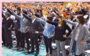
▲皆で力をあわせてがんばろう！

同日までに基幹病院の整備を求めた11万9996筆の署名が集まり、27日に同推進会議要請団により翁長雄志県知事に届けられました。