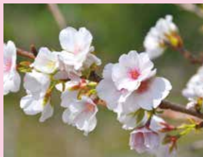
▲満開に咲いたクメノサクラ

会場は、たくさんクメノサクラに囲まれ、訪れた方々はクメノサクラ独特の色や香りを感じながら花見を満喫していました。