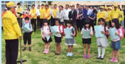
▲元気に宣言する新1年生のこどもたち

また、今年が町内小学校の新年生が同出発式に参加し、「『青信号 しっかりとくにんわたらうね！』のスローガンをしっかりと守ります」と交通安全宣言をした後、本部地区交通安全協会からランドセルカバーと交通安全グッズを贈呈され、笑顔を浮かべていました。