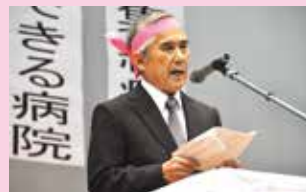
▲力強くあいさつをする高良町長