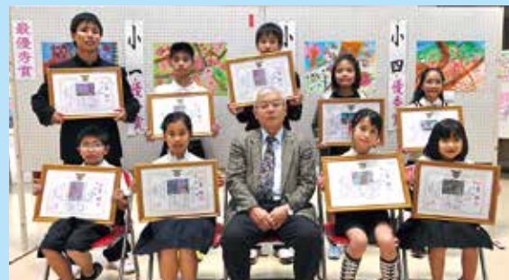
▲表彰された皆さんおめでとうございます！