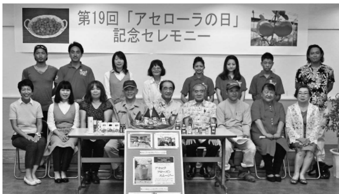
▶アセローラの日記念セレモニー

本部町の特産であるアセローラをPRするため制定された、5月12日の「アセローラの日」を記念し、生産者へ表彰を行うアセローラの日記念セレモニー(主催・アセローラの日記念セレモニー実行委員会)が町産業支援センターで開催されました。