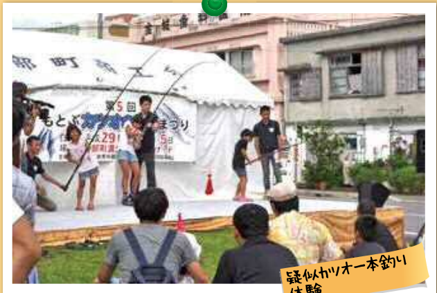
疑似カツオ一本釣り 体験