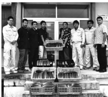
▲青年農業者(左)からゴーヤーを受け取る渡久地センター長(右)

寄贈されたゴーヤーは、同日にゴーヤーチャンプルーとして、町内小中学校の給食に提供されました。