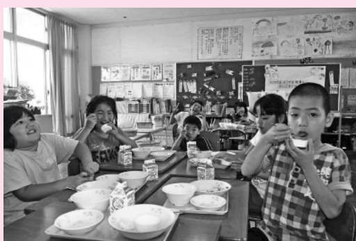
▲大好きなゼリーを食べて、大はしゃぎの崎本部小学校の子ども達