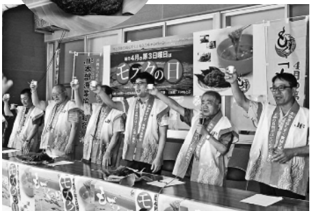
▲もとぶ美ら海もずくで乾杯!