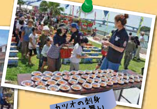
カツオの刺身 無料振る舞い