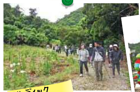
ハルディック ウォーキング

ゴールデンウィーク中、町内各所でイベントが開催され、多くの人で賑わいました！ 第5回もとぶカラスト山ゆり祭り(5月3日)