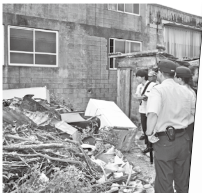
▲町内の不法投棄現場を回る参加者ら

町では、今後も不法投棄禁止等の看板設置やパトロールを強化し、不法投棄ゼロを目指す方針です。