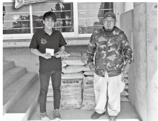
▲たくさんの堆肥の寄贈ありがとうございました。