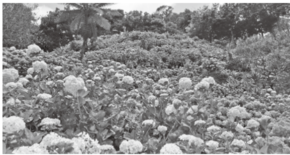
丘一面に広がる花々