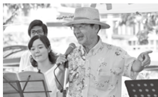
▲激励に駆けつけた平良副町長