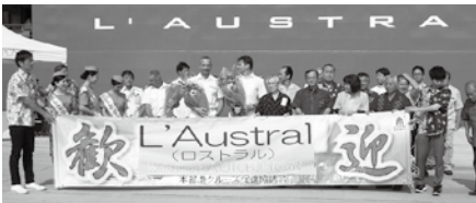
▲ロストラル号の船長らと記念撮影 ようこそ本部町へ