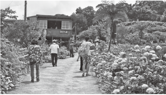
園内の花々を楽しみながら散策する来場者

5月中旬から6月下旬にかけて、伊豆味地区のよくなあじさい園のアジサイが開花のピークを迎えました。園内は、約40種、1万株のアジサイのほか、ペゴニアやメデイニラマグニフィカなど約100種類の花々を観賞することができます。来場者は、丘一面に広がる鮮やかな花の色と香りを楽しみながら園内を散策していました。同園によると、開園期間中の来場者数は2万人に達する見込みとのこと。