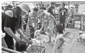
▲ヤギと触れ合う子どもたち

とあいさつした後、ピージャーズの演奏に合わせ、平和を願ったオオゴマダラの蝶々飛ばしが行われました。会場では、町内団体によるステージイベント、町産品の無料配布、ヤギとの触れ合い体験、町産養殖マグロの解体ショーなどの多くの催しが行われたほか、会場地下では、もとぶフェアも同時開催され、町の特産品販売が行われました。会場には町出身者や地元の方々、観光客など多数が来場し、普段体験できない町の魅力に触れ、イベントを楽しんでいました。