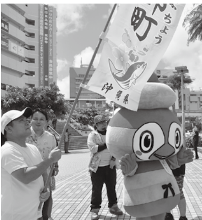
▲ぶとモーも一緒に本部町をPR！