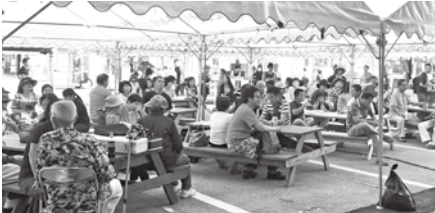
▲乗客達で大賑わいの夕市の会場