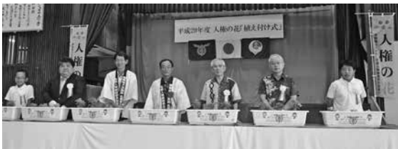
▲関係者と児童でプランターに花を植付け

上本部小学校で 人権の花植え付け式を開催 9月22日、人権啓発活動の一環として上本部小学校で「平成29年度人権の花植え付け式」(主催・本部町、本部町教育委員会、本部町立上本部小学校)が開催されました。植え付け式には、ベゴニアとマリーゴールドの苗が200本ずつ用意され、上本部幼稚園の園児と上本部小学校の児童たちがプランターへ植え付けを行いました。今回植え付けした花は、12月に開催予定の「人権の花開花式」に向けて同校で大切に育てられます。