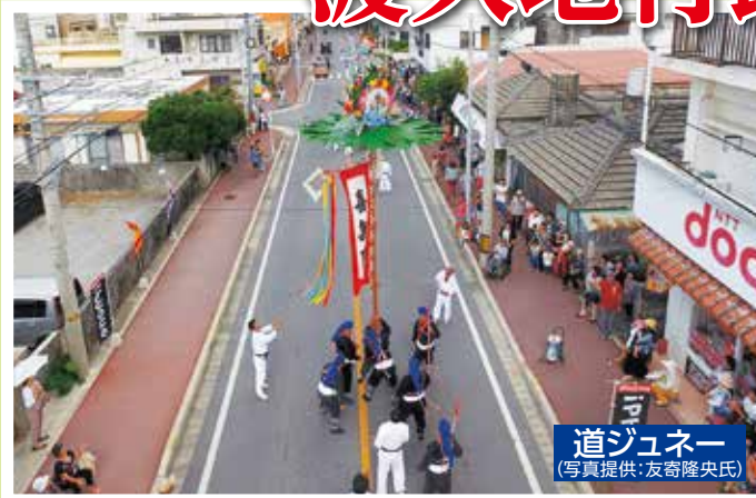
道ジュネー