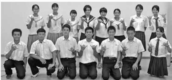
▲留学の報告をした生徒の皆さん

本部っ子 短期留学 チャレンジ事業報告会 「本部っ子短期留学チャレンジ事業」により7月24日(8月7日の15日間、ハワイ州へ派遣された中高生15人が9月22日、本部町役場で留学を終えての報告を行いました。生徒たちは報告の中で、ホームステイの思い出や、ハワイの文化や歴史について学んだことなどを話し「自身の英語力を試すいい機会となった」、「今後もっと英語を頑張りたい」という意欲につながった」と、留学を通じての感想を述べました。