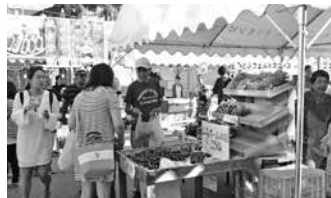
▲多くの人で賑わう会場

第2回 もとぶシークワサー祭 第2回もとぶシークワサー祭(主催・もとぶ産シークワサー生産消費拡大推進協)が9月30日と10月1日の2日間、アジマーもとぶで開催されました。会場ではシークワサー関連商品の販売やシークワサーにちなんだステイジイベントなどが行われたほか、別会場ではシークワサー機能性講演会やシークワサー狩り体験などが行われ、シークワサーづくしの祭りとなり、両日とも多くの人で賑わいました。