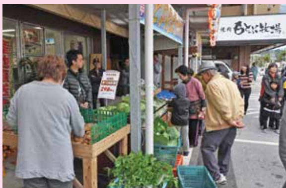
▲多くのお客さんと賑わう会場