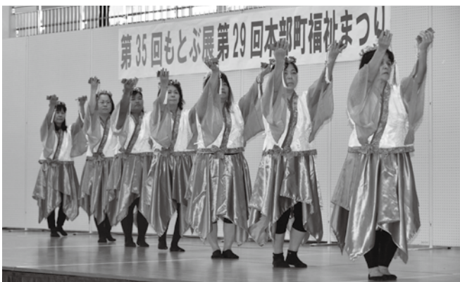
▲日頃の練習の成果を披露するサークル団体