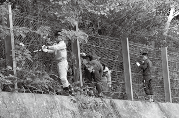
▲県道84号線沿道で作業する皆さん

11月24日、もどぶ八重岳桜まつりに向けた美化整備の一環として、八重岳沿道周辺の桜のツル刈り作業(主催・本部町観光協会、本部町)が実施されました。この取り組みは桜まつり前に毎年行っており、今回は町建設業者会、町観光協会、伊豆味行政区民など81人が参加しました。桜の生長や景観を妨げるツル刈り作業を行うことで八重岳周辺の景観が大きく改善されました。