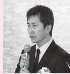
▲各部門で受賞された6人の方々