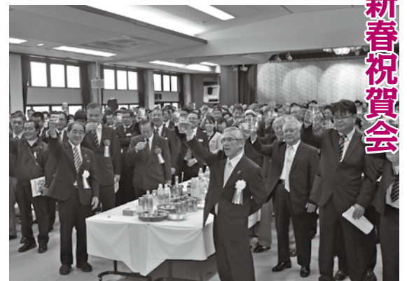
▲飛躍の年を願い全員でカーリー!