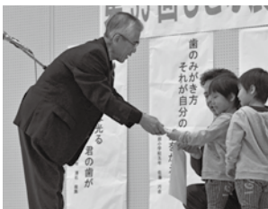
▲高良町長からむし歯ゼロを表彰される幼児たち

ステージでは「3歳児健診むし歯ゼロ発表会」、「歯の健康標語コンクール表彰」などが行われたほか、町内各サークル団体による演舞なども行われました。