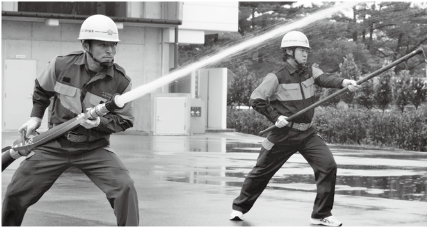
▲消防団員による小型ポンプ操作