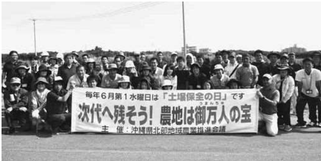
講習会に参加した皆さん

農業生産の場における、土壌の流出防止や土壌保全の必要性についての農家の意識高揚を図るため沖縄県が設置した5月第3週月曜日から30日間の「土壌保全週間」の取り組みとして6月5日、「土壌保全の日」講習会(主催・北部地域農業推進会議、本部町)が開催されました。 講習会には、町内農家や関係者合わせて約60人が参加し、町産業支援センターにおいて、土壌流出防止対策技術について講座が行われたあと、備瀬川の圃場で土壌流出防止に向けたベチパー苗の植栽作業が行われました。 北部地域は、国頭マジジと呼ばれる土壌が多く、海などへの赤土流出が問題となっています。本町では、平成28年度から「本部町赤土等流出防止営農対策地域協議会」を設立し、町内圃場周辺におけるグリーンベルトの設置等を推進しています。