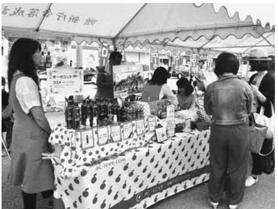
賑わう会場の様子

5月12日の「アセローラの日」をPRするイベント（主催・アセローラの日PRイベント実行委員会）が5月12日、もとぶかりゆし市場前広場において開催されました。 このイベントはアセローラの日が制定された1999年5月12日に初開催されて以来、今年で20回目を迎え、ジュースや化粧品といったアセローラ加工商品の販売や、挿し木づくり体験、畑視察ツアーなどが行われ、様々な形でアセローラを楽しむイベントとなりました。 ステージイベントでは、風のお保育園児らによるアセローラ体操やゆい保育園児らによる子ども演舞なども行われ、大人から子どもまで多くの来場者で賑わいました。