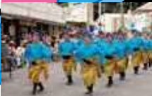
道ジュネー(パレード)

美らなる島の輝きを御万人へ 一般財団法人 沖縄美ら島財団 Okinawa Churashima Foundation http://churashima.okinawa/