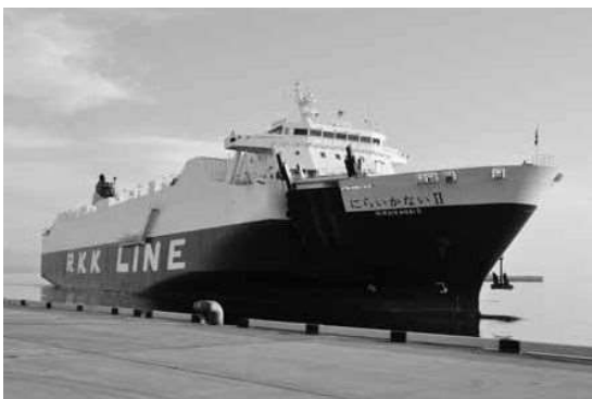
本部港に寄港する「にらいかないⅡ」

「にらいかないⅡ」初就航記念セレモニー 本部港から東京、大阪方面の航路を確保し、北部地域の物流の効率化と陸上輸送コストの低減を目指す北部連携物流拠点機能強化事業を活用した社会実験として、今年度から琉球海運株式会社「にらいかないⅡ」（全長181.5メートル、総トン数11,687トン）が寄港することに伴い6月5日、本部港において初就航記念セレモニーが開催されました。