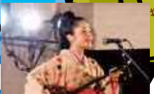
第15回本部ナーク三大会