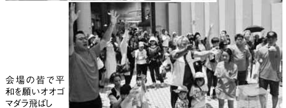
皆で平和を願うオオゴマダラ飛ばし