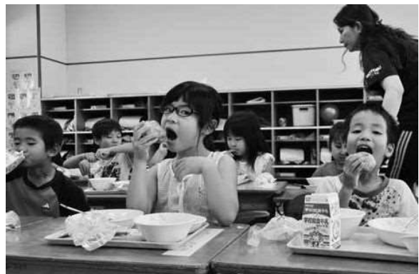
美味しく食べてバターじゃがを食べる本部小学校の児童たち

本町と「友好の町・盟約調印」を締結している北海道南富良野町から、同町の町制施行50周年を記念して、本町へじゃがいもの加工食品「バターじゃが」約1500個の寄贈がありました。5月16日に町内の学校給食に提供されました。 両町は、平成2年から互いに児童を派遣し、文化や歴史、自然を学ぶ交流事業を続けています。今年は6月に南富良野町の児童が本部町を訪れており、来年1月には本部町から南富良野町へ児童が派遣される予定です。 本部小学校1年生の児童たちは、じゃがいもをまるごと使用したバターじゃがを食べ「バターの味が甘くておいしい」と大はしゃぎの様子でした。 なお、5月12日のアセロラの日には、本町から南富良野町へアセロラゼリーの寄贈を行っています。