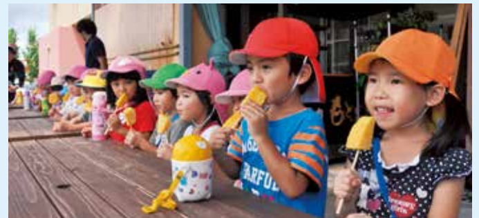
あまーいパイナップルを堪能する渡久地保育所の園児たち

出荷式では試食会も行われ、参加した渡久地保育所の園児たちは「甘くてとても美味しい」と笑みを浮かべていました。