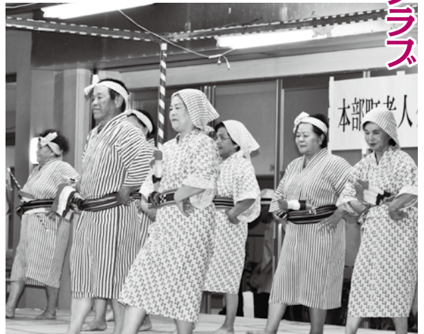
谷茶地区の「谷茶大漁節」

7月19日、毛あしび18番大会(主催・町老人クラブ連合会)が町地域福祉センター中庭で行われ、約450人が参加しました。町内13地区の老人クラブがそれぞれ芸を披露し、「めでたい節」「肝がなさ節」「はんた毛」「稲しり節」など民謡に合わせてお揃いの衣装で踊りました。また今大会は、10月31日に名護市民会館で行われる北部地区老人芸能大会の町代表選出も兼ねており、審査の結果、谷茶地区の「谷茶大漁節」が代表に選ばれました。