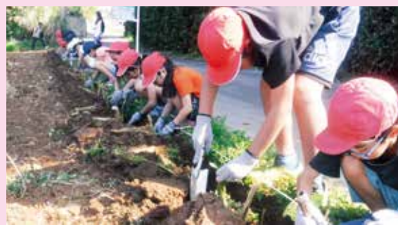
グリーンベルトを植栽してきれいな海を守ろう！

植物を帯状に植栽することで、流れ出る雨水に含まれる赤土等をろ過する役割があります。