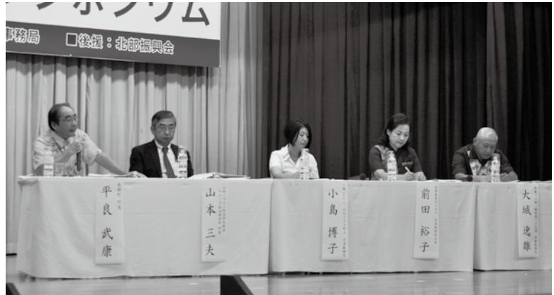
討論で意見を述べる平良町長(左)