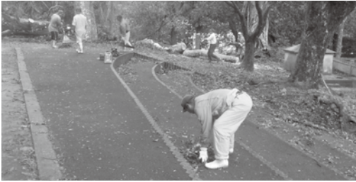
清掃作業を行う伊豆味区の皆さん

9月末から2週連続で沖繩に上陸した台風24号・25号に伴い、町内各所で倒木等の被害が発生しましたが、町民の皆さまの自主的な清掃作業により、生活道路等の復旧作業を円滑に行うことができました。町民の皆さまには心より御礼を申し上げますとともに、今後とも町政運営へご協力賜りますようお願い申し上げます。