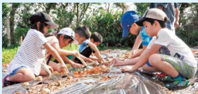
一生懸命植付けする子どもたち

今回植付けされたじゃがいもは来年、同学童の子どもたちが収穫を行い、貧困家庭や孤食の子どもに食事を提供する「子ども食堂」の食材として活用されます。