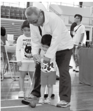
お孫さんといっしょに競技を楽しむ参加者

老人の健康増進と地域間の交流を深めることを目的に11月5日、町運動公園で老人スポーツ大会(主催・町、町老人クラブ連合会)が開催されました。当日は、雨天のため町民体育館で行われましたが、各字から多くの老人の皆さまが集まり、輪投げ、ピンボウリング、安全吹き矢などの競技を老人だけでなく、お孫さんも一緒に楽しんでいました。各団体とも工夫を凝らした応援で会場を盛り上げ、笑いの絶えない活気ある大会となりました。