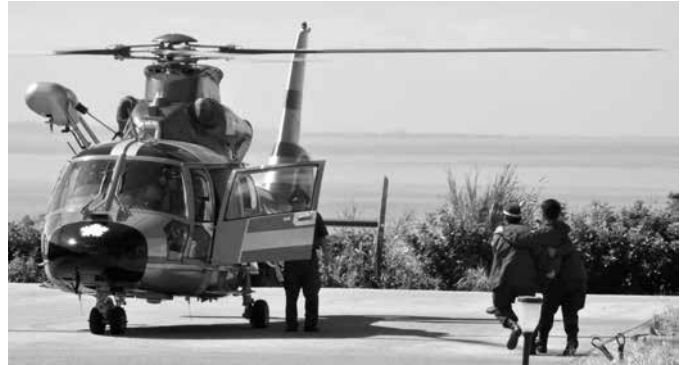
負傷者をヘリに乗せる訓練を行う署員ら

また訓練後は、ゆい保育園の園児たちが「しまもり」とパトカーの内部見学を行い、初めて間近で見る乗り物に大興奮の様子でした。