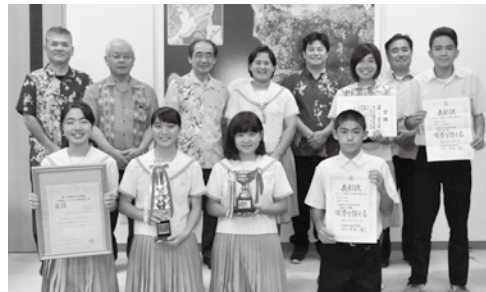
報告に訪れた本部中の生徒たち