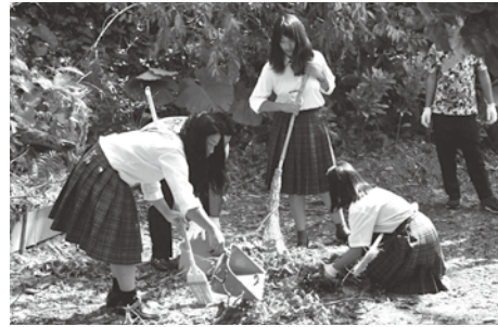
ボランティア清掃を行う本部高校生の皆さん

9月末に沖繩に上陸した台風24号に伴い町内各所で被害が発生したことから、本部高校福祉コース2年生が、身寄りのない老人宅の清掃作業を行いました。庭の倒木の撤去や落ち葉の掃き掃除など約1時間かけて作業し、生活に支障が出ない程度の状態まで回復しました。自宅が停電中という生徒もいる中、制服が汚れながらも一生懸命汗を流し、作業を行っていました。