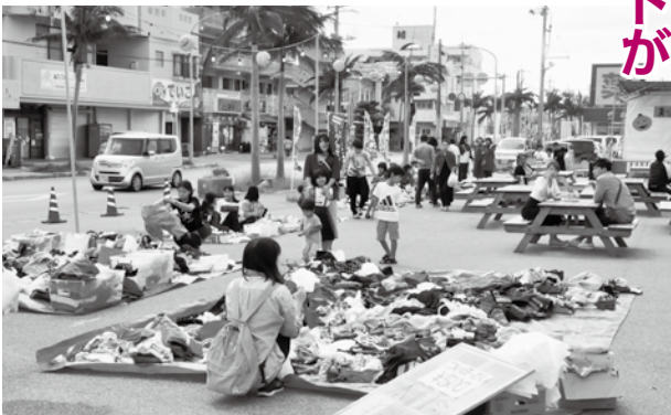
賑わう会場の様子

同イベントは2ヶ月に1度、月の最終日曜日の11時から16時に、同広場で開催されています。