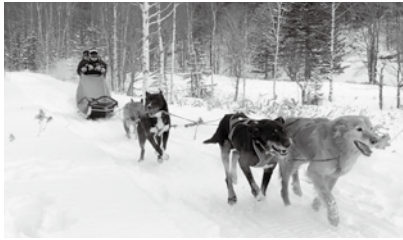
右下：一面に広がる雪景色に大興奮