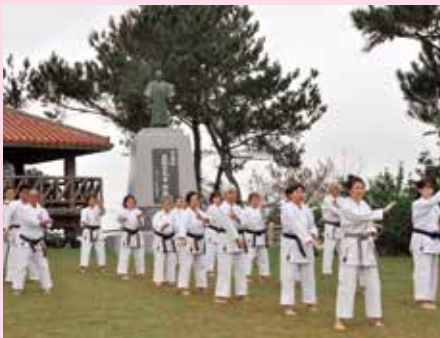
沖縄空手上地流の奉納演舞

まつりのオープニングで平良町長は多くの桜を植えた先人に感謝の言葉を述べ「全国の桜前線は、八重岳からスタートする。来場者に祭りを満喫してもらいたい」とPRしました。19日、20日にはいちばん桜歩け歩け大会、本部小学校音楽部演奏、本部高校学習成果発表、MOTOBUっ子ショー、石くびり大会など多彩なイベントが行われました。まつり期間中、約12万7千人の来場があり、桜並木の散策や写真撮影など多くの方が八重岳の桜を楽しんでいました。