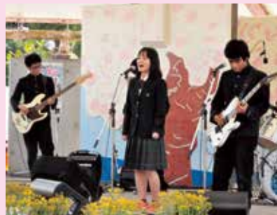
本部高校生によるバンド

ご協賛いただきありがとうございます。大盛況に終わりました第41回もとぶ八重岳桜まつりへ町内外から多数のご協賛をいただき誠にありがとうございました。