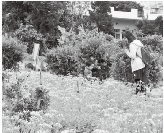
黄色い花畑で走り回る子どもたち