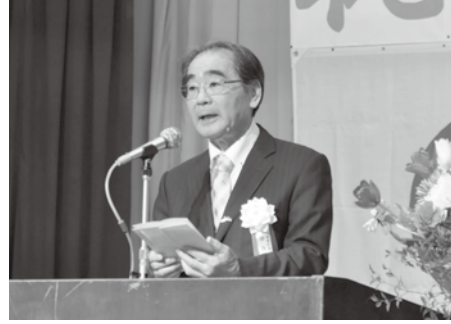
良町長が式辞を述べる

良町長は「これから社会の中で活動する皆様には、文武両道と先駆者の気質である『武本部』の精神で、失敗を恐れず、勇気を持って目標に立ち向かっていただきたい」と激励の言葉を贈りました。