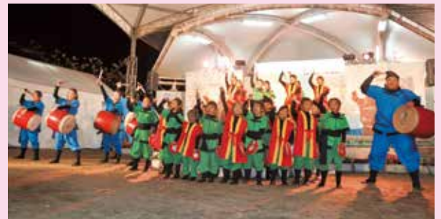
もとぶ八重桜花団・本部っ子八重さくら太鼓演舞