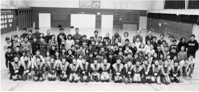
南富良野町の児童との交流会

町内小学校との交流学習やスキー体験、犬ぞり体験、ワカサギ釣り体験、カーリング体験、ホームステイなど雪国の生活や文化を肌で感じてきました。またカーリング体験では元オリンピック選手（南富良野町出身）に直接ご指導をいただき貴重な体験となりました。 今年の6月末には、南富良野町の交流団が沖繩の夏を体験するため本町を訪れる予定です。町民の皆様をあたたかい歓迎をよろしくお願いたします。