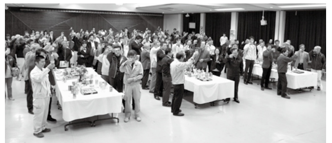
町の産業発展を願い、カーリー！

役員関係者、農協関係者、商工会や観光協会なども参加し、農業と他産業の連携強化を誓いつつ、互いに交流を深めました。