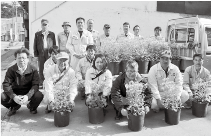
作業に参加した皆さん

同協会は、町内の清掃作業や町花いっぱい推進協議会への参加など、町の美化活動に取り組んでいます。