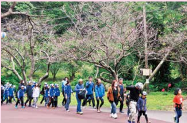
いちばん桜歩け歩け大会