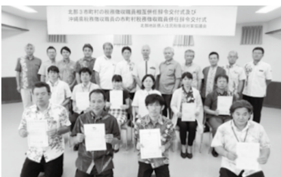
辞令交付を受けた3市町村の徴収担当職員

5月16日、名護市・本部町・今帰仁村の北部管内3市町村は税の公平性の確保、税徴収率向上を目指し、徴収担当職員が他の2自治体でも徴収業務が可能となる「相互併任」のための辞令交付式が行われました。 税務徴収職員の人事交流を図り、情報交換や徴収方針の協議・滞納処分を行い徴収率アップに貢献していきます。