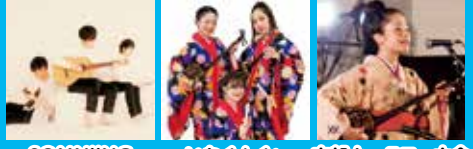
SOMNIING いなぐんぐわ 本部ナークワニ大会