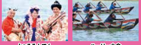
とるるんでん ハーリー大会