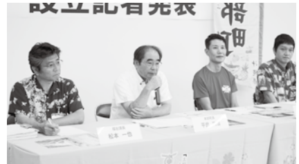
寄付を呼び掛ける平良町長

平良町長は「子ども達が明るく過ごせるための支援を行っていくため、町を離れている人など、多くの方に寄付をお願いしたい」と呼びかけました。寄付については、本部町総務課(TEL/0980-47-2101)までお問い合わせください。