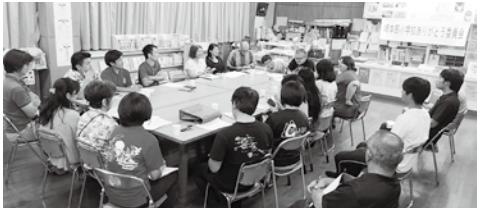
閉校行事について話し合う委員の皆さん

令和2年3月31日に 崎本部小学校が閉校し、 本部小学校へ統合する こととなりました。閉 校に向けて、昨年度か ら「ありがとう委員会」 を立ち上げ、定期的に 話し合いを持ち、様々 な行事を企画しており ます。多くの皆様が崎 本部小学校においてな り、子どもたちを激励 するとともに、互いの交 友を深める機会となれ ば幸いです。