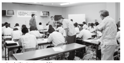
⑤ 本高チャレンジ塾

本部高校生徒の学習意欲の高揚と学力の向上を図り、将来地域を担う人材の育成を目的に開講。