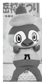
③ぶとモーお披露目

ぶとモーは本町のキャッチフレーズ「太陽と海と緑—観光文化のまち」をイメージしたカラーリング（太陽＝赤、海＝青、緑＝緑）、頭のデザインは町章をモチーフとしており、本町のイメージにフィットしたキャラクターとなっています。