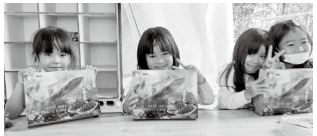
沖縄美ら島財団よりお菓子寄贈