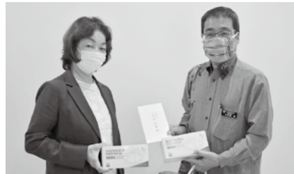
光文堂コミュニケーションズ株式会社よりマスク寄贈