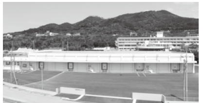
④ 本部町物流センター