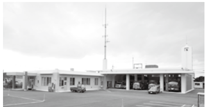
② 本部町今帰仁村消防組合消防本部新庁舎

新庁舎は鉄筋コンクリート造1階、建築面積1,057平方メートルで機材置場や薬品室などに使い勝手の良い設備がなされ、十分な広さを確保した車庫が整備されました。また、通信室、待機室、消防衣置場、仮眠室と緊急時の対応性を高める工夫が至る所に施されており本部・今帰仁の防災拠点にふさわしい消防庁舎となっています。