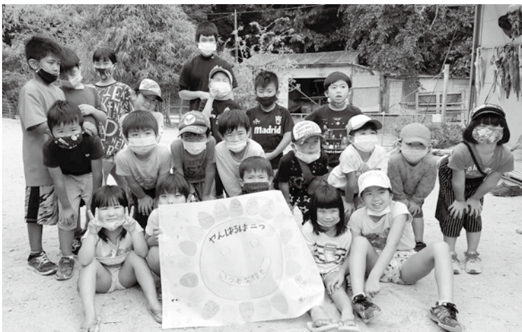
子ども達から株式会社前田産業ホテルズへお礼状