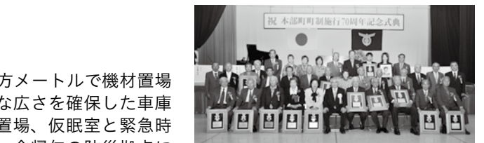
① 町制70周年記念式典