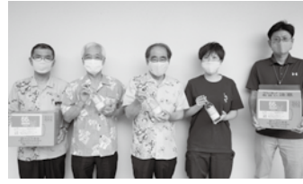
新商品泡盛の寄贈