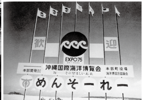
沖縄国際海洋博覧会のシンボルマーク