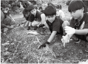
芋ほり体験を楽しむ子どもたち