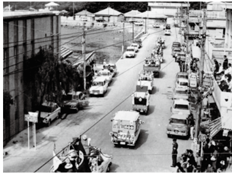
新生本部町誕生記念パレード