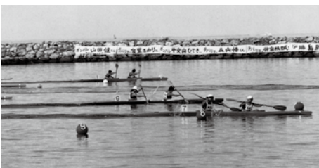
海邦国体で町出身の選手が活躍したカヌー競技(少年)