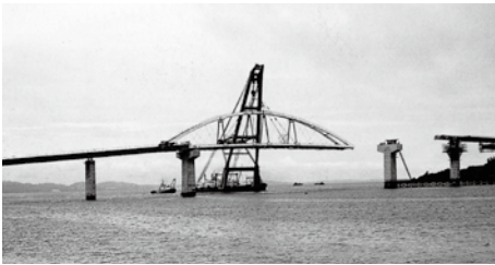
橋の中央部分を連結する大型クレーン船 昭和59(1984)年5月27日