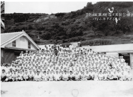
パイナップルの頃の琉球果樹園の女工 台湾からもたくさんの女工たちがやってきた (現役場、旧本部国民学校跡地)