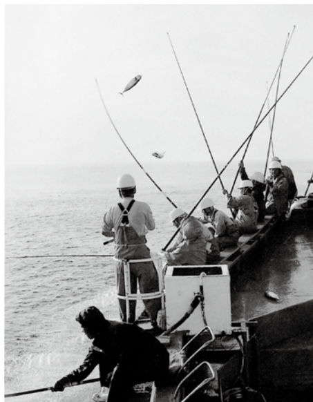
餌をまきながらカツオを釣りあげる一本釣り