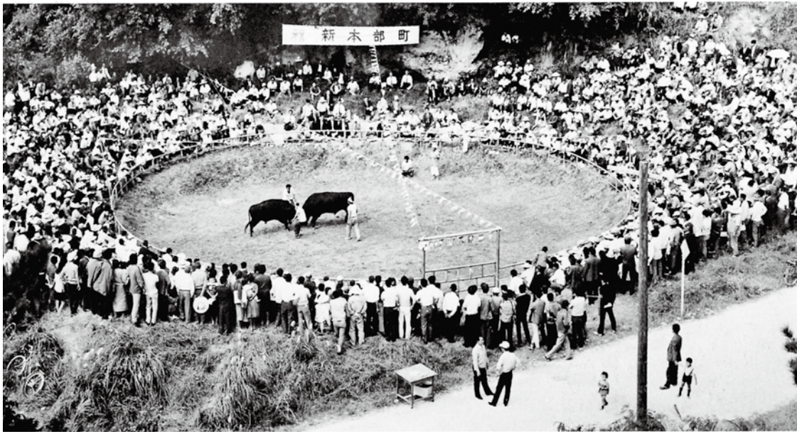
新生本部町誕生記念 闘牛大会