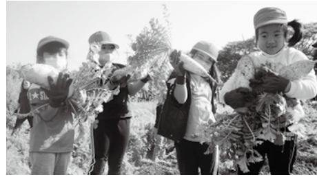
大根の収穫を楽しむ子ども達

昨年10月に行われた植え付け体験で植付けした野菜の収穫が、2月24日に宇浦崎の畑で行われました。渡久地保育所、伊豆味幼稚園、瀬底幼稚園、上本部幼稚園の園児達がじゃがいも、人参、大根、玉ねぎを青年農業者の会の皆さんと一緒に収穫しました。