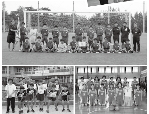
本部中学校サッカー部、初優勝旗を受け取る選手たち、伊豆味中学校男子バレー部、本部中学校女子バスケットボール部