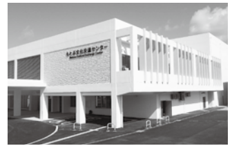
もとぶ文化交流センター(本部町大浜)

本部町大浜に「もとぶ文化交流センター」が完成しました。大ホールや図書資料室、各種研修室を完備し、地域の文化交流の拠点施設となるよう期待されています。施設の詳細は広報8月号でもお知らせ致します。7月30日(金)には関係者による内覧会を予定しています。施設の一般利用は7月31日(土)からとなります。利用や予約等については下記までお問合せください。