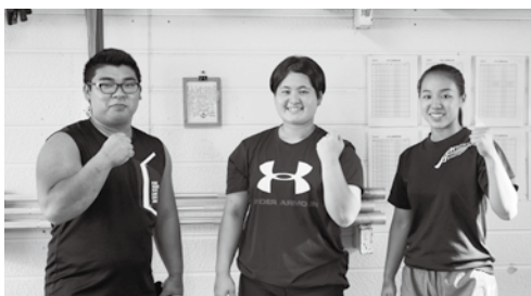
本部高校ウエイトリフティング部