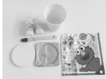
デコパージュ作成キット

【郵送内容】 デコパージュ作成キット:コースター2枚、デコパージュ液2種、筆×1本、ペーパーナブキン1~2枚(絵柄はイメージです) あまびえのお守り、簡単ふりふりアイスクリームレシビオおまけ付き! ★夏休み自由研究にも役立つ内容になっています(^^♪