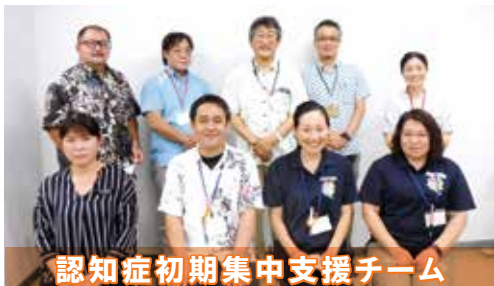
認知症初期集中支援チーム

認知症専門医と医療・介護の専門職で構成されたチームです。認知症の方やその家族のもとに訪問して、困りごとや心配ごとの相談に応じます。