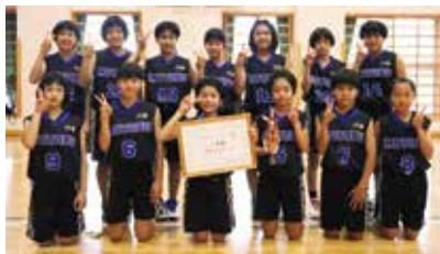
本部小学校ミニバスケットボールAチーム