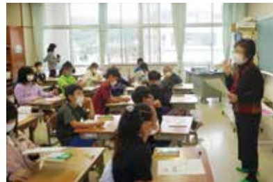
しまくとうばを教わる子どもたち

対する知識と理解、会話能力の習得と向上を図る目的で実施しています。北部地域では初めての取り組みで、今回は渡久地地区のしまくとうばの9級の検定が行われました。