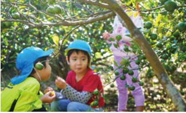
シークワサー狩り体験を楽しむ子どもたち

子どもたちに、シークワサーのことを知っていただき、少しでも農業に興味を持ってもらえたら嬉しい」と話しました。