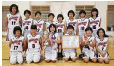
本部小学校ミニバスケットボールBチーム