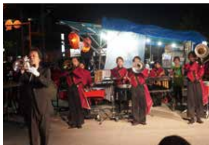
本部小学校音楽部