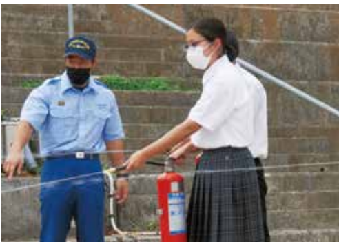
消火器を実際に使っている様子

の際には、落下物から頭を守ることが重要で効果があり、被害を最小限にする」との助言がありました。