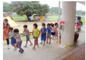
列になって避難する園児たち(ドリーム保育園)