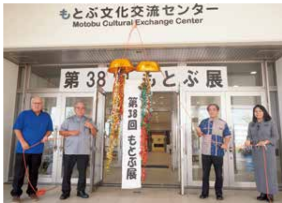
オープニングセレモニーの様子