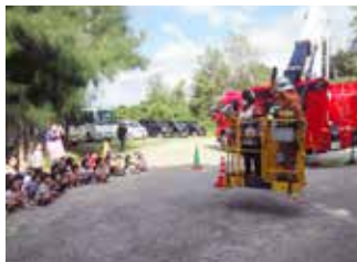
消防の消防車に試乗する先生(こすも保育園)

また、園児たちは「お・か・し・も・ち」(おさない・かけない・しゃべらない・もどらない・ちかづかない)を意識した避難の大切さや、火災の恐ろしさについて消防職員の話真剣に聞き入っていました。