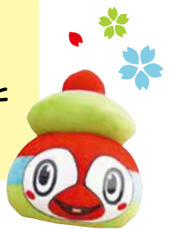
本部町キャラクター ぶとモー

もとぶ商品券の引換 及び使用期限が、 2023年1月31日まで と なっています。 お早めにお使いください!