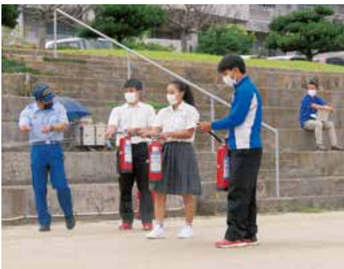
消火器の使い方を教わる生徒ら

当日は、本部消防署員の立ち会いもあり、訓練や避難の様子について講評をいただき、特に「地震