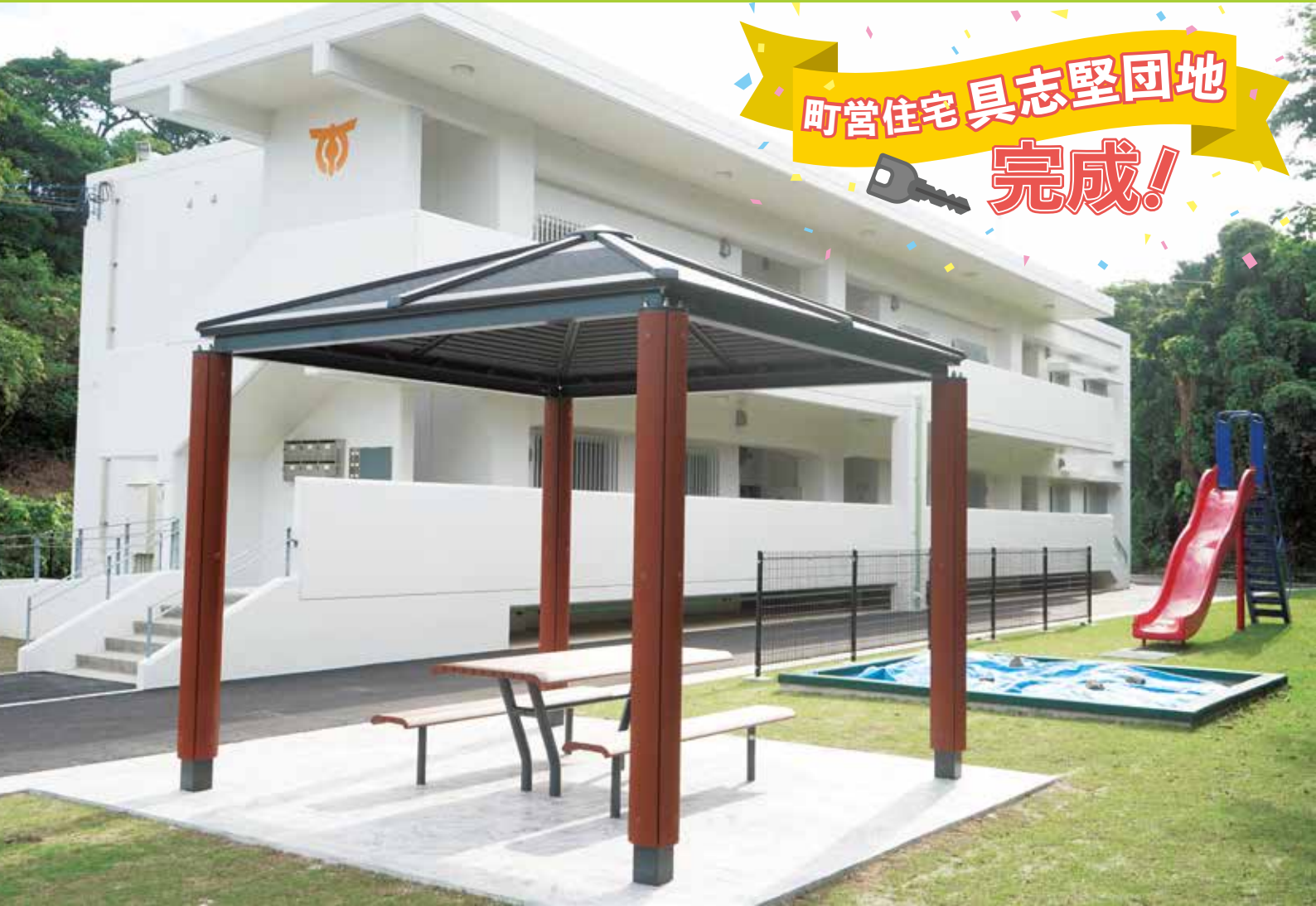
具志堅区に子育て支援住宅が完成し、12月9日に入居者の鍵引渡し式が行われました