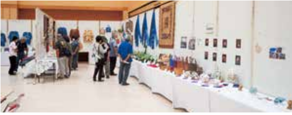
作品を鑑賞する方々

これを機に文化のまち本部町を 目指していきま しょう」と思い を語りました。 訪れた方々か らは「久しぶり の開催でとても 嬉しく思う。ど れも素晴らしい 作品ばかりで感 動した」との声 が聞こえてきま した。