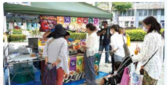
町の特産品を買い求める来場者