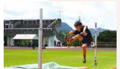
新記録を出した6年男子走り高跳び