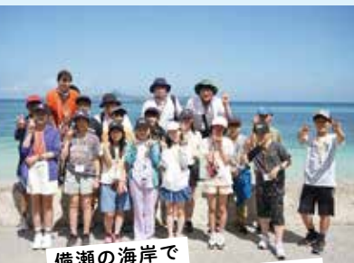
備瀬の海岸で みんな一緒にハイチーズ!