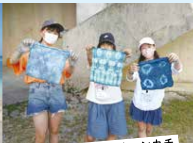
オリジナルの藍染めハンカチ