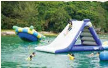
海でアスレチックを楽しむ様子