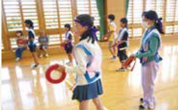
エイサー体験をしている様子