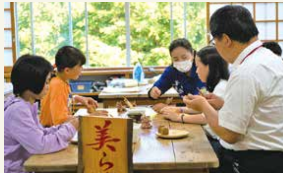
シーサー作り体験の様子