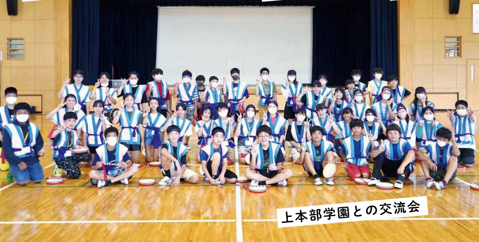
上本部学園との交流会