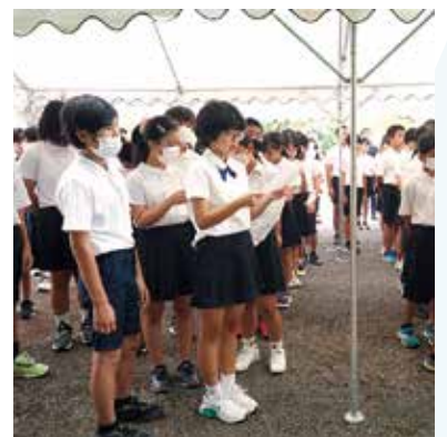
「月桃の花」を合唱する児童ら