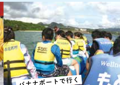
バナナボートで行く サンゴ礁ツアー!!