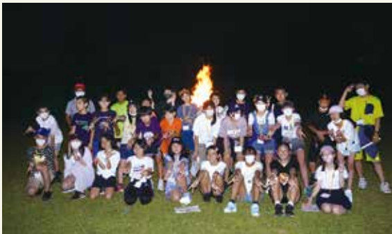
キャンプファイヤーで交流を深めた児童ら