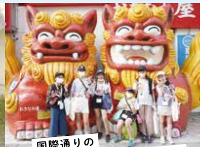
国際通りの 大きなシーサーと記念撮影