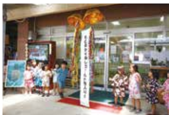
くす玉を割る園児ら