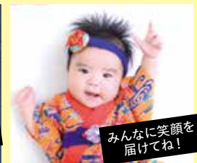
みんなに笑顔をお届けしてね！