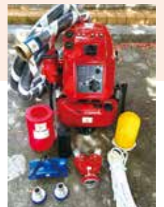
水納島に整備された可搬消防ポンプ一式