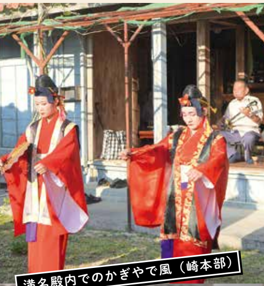
満名殿内でのかぎやで風 (崎本部)