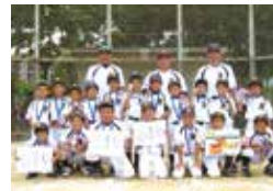
本部少年野球クラブ