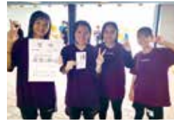
本部中女子B(準優勝)