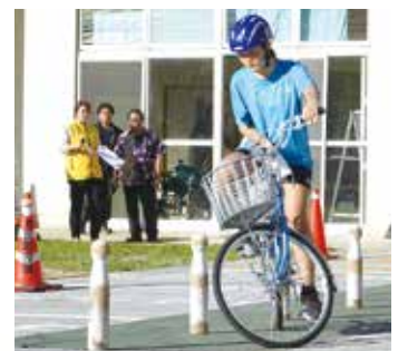
自転車の実技を披露した 上本部学園児童