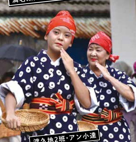
渡久地2班・アン小達