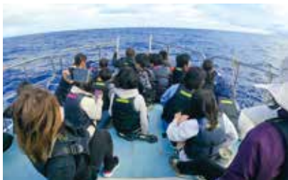
クジラを探す子どもたち