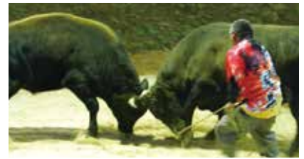
牛がぶつかり合う迫力ある試合