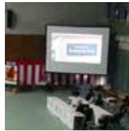
思い出のアルバム