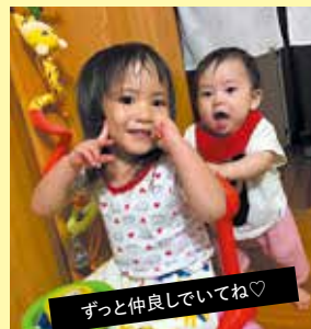
ずっと仲良しでいてね♡