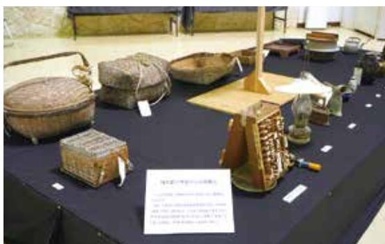
旧崎本部小学校からの寄贈品

2月13日~3月24日、町立博物館で「令和5年度収蔵品展」が開催されました。本企画展は、平成29年から令和5年に主に町内外から寄贈された収蔵品を展示・公開し、博物館事業への関心を高めることを目的としています。崎本部小学校の閉校にともなう多くの資料を展示する特設ブースも設置され、来場者はかつての学校生活を懐かしんでいました。