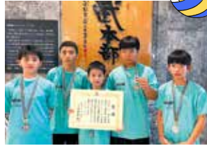
準優勝 男子国頭選抜