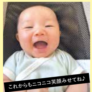
これからもニコニコ笑顔みせてね♪