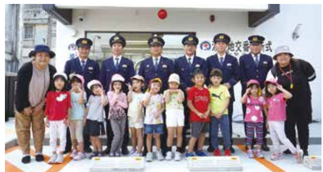
渡久地保育所の園児らと関係者ら

2月20日、渡久地交番開所式が行われました。県道84号線各幅工事に伴い、新築移転工事を進めていた旧渡久地交番は、昭和57年に創設され約42年にわたり安全安心の拠点として地域に親しまれてきました。本部警察署の地下実署長は「これまで以上に地域に密着した警察活動に努めていきたい」と意気込みを述べました。また、同式では渡久地保育所の園児がダンスを披露し、新交番の開所を喜びました。