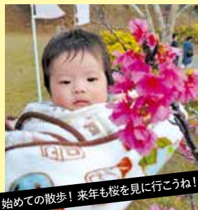
初めての散歩！来年も桜を見に行こうね！