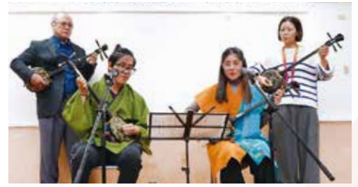
三線の成果を披露した研修生ら

同式では、三線教室で習った安波節、安里屋ユンタ、デンサー節の三曲を披露し会場を盛り上げました。