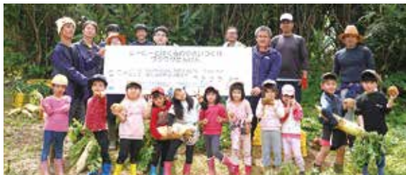
渡久地保育所の園児ら

3月4日、昨年の11月に植え付けを行った野菜の収穫が字浦崎の畑で行われました。渡久地保育所、伊豆味幼稚園、瀬底幼稚園、上本部幼稚園の園児らが大根・ジャガイモ・玉ねぎを青年農業者の皆さんと一緒に収穫しました。友達と大きな声をかけながら協力し合って、大根を引っ張る姿もありました。