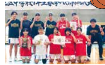
本部中学校・今帰仁中学校の合同チーム