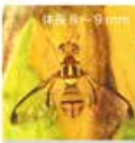
セグロウリミバエ

本部町内において令和6年10月、海外から侵入した農作物の害虫セグロウリミバエがトラップ調査により発見されました。本種がまん延すると農作物に大きな被害を及ぼす恐れがあるため、防除を実施しております。皆様の防除へのご協力を願っています。