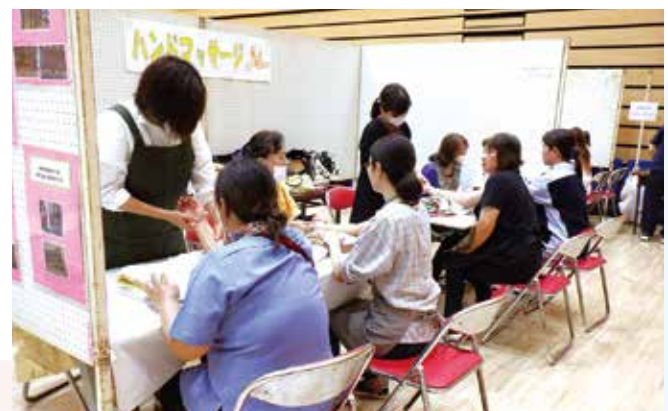
ハンドマッサージを受ける来客者

11月17日、もとぶ文化交流センターで第36回本部町健康とふれあいの福祉まつりが開催されました。本祭りは、「誰もが安心し、支え合うまち本部町」をテーマに、福祉まつりを通して、すべての町民が住み慣れた地域社会の中で健やかで心豊かに生活できる共生社会の実現を目的としています。祭りでは、町内の保育園児や老人クラブ・サークル団体による舞台発表や作品の展示、名桜学生による健康測定などが行われました。