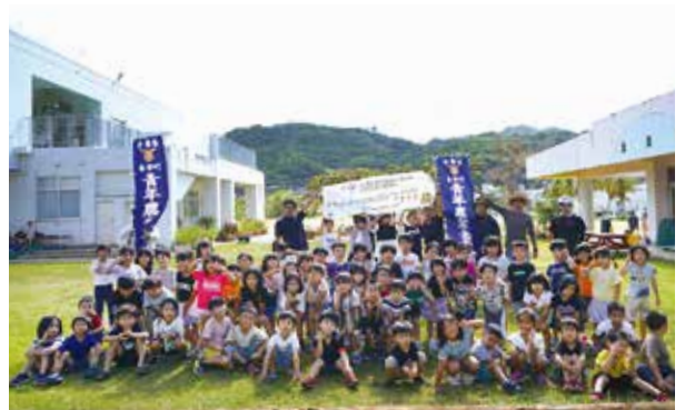
植え体験を行った本部幼稚園