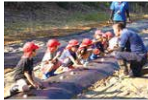
植え方を教わる子どもたち