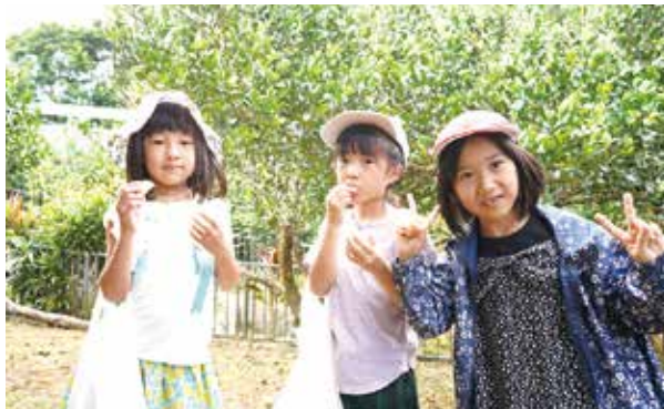
カーブチーを味わう様子

カーブチーの「カー」は「皮」、「ブチー」は「厚い」という意味でその名のとおり皮が厚いのが特徴で、児童らは名前由来もクイズ形式で学びました。