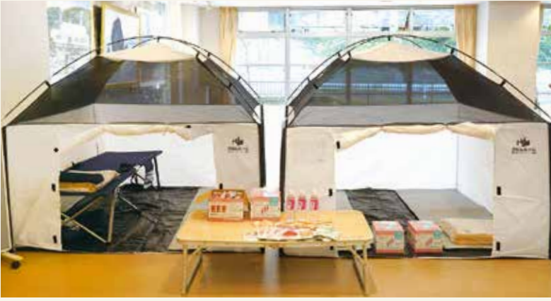
避難所設置に使用したテントや非常食等