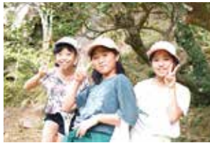
仲良く3人組でパシャリ！