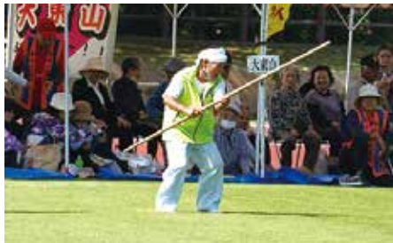
応援団による棒術の披露