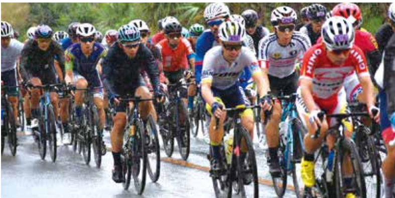
当日のレースの様子