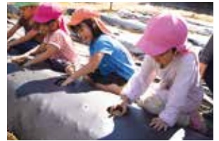
じゃがいもの植え付け