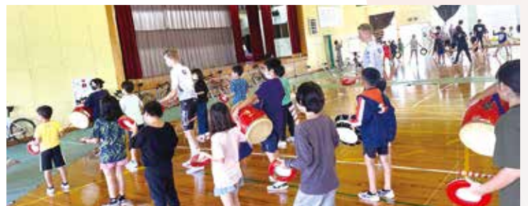
エイサーをレクチャーする瀬底小学校の生徒たち