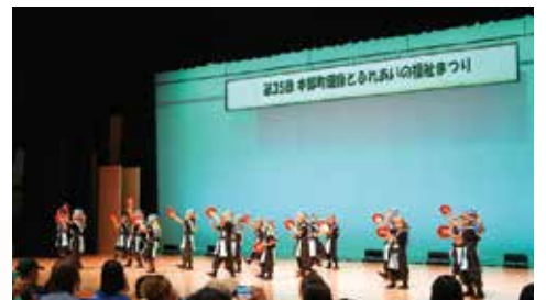
ゆい保育園によるエイサーの披露