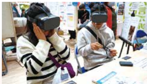
VRを体験する南米子弟研修生