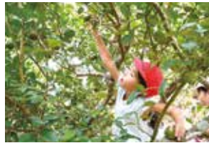
懸命にカーブチーを狩る様子