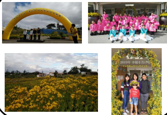
リュウキュウベンケイ祭りの状況