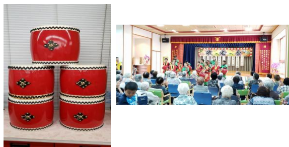
本部っ子活動支援事業の状況