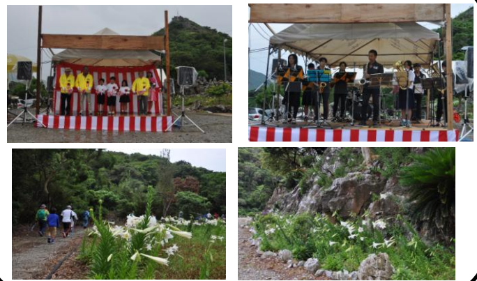
カルスト山ゆり祭りの状況