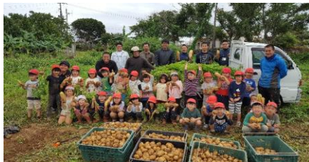
本部町青年農業者の会の活動状況