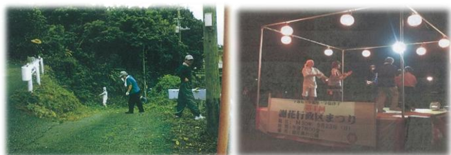
行政活性化事業の様子