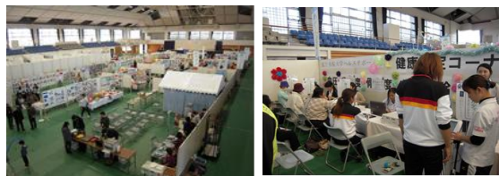
福祉まつりの開催の様子