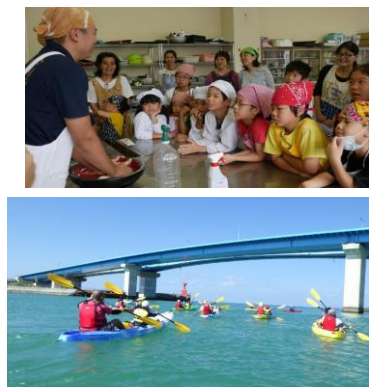
もとぶ再発見事業の様子