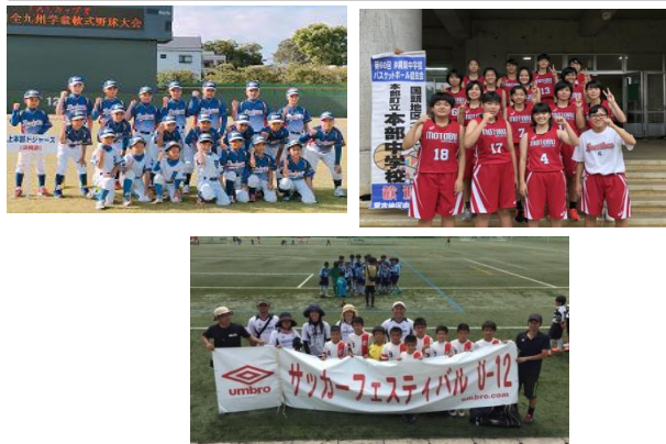
派遣費補助を受けた児童及び生徒の状況