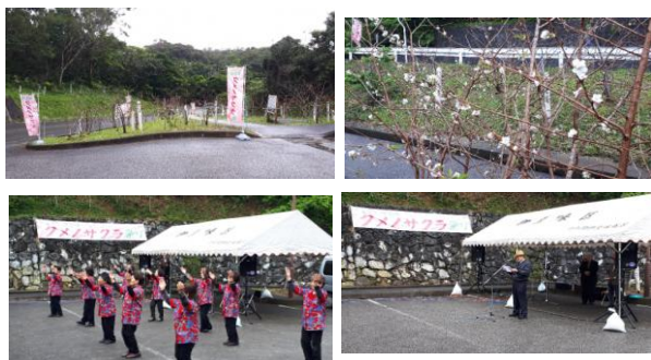
伊豆味クメノサクラ祭りの状況