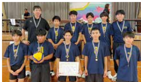
本部中学校 男子バレーボール部 第42回新報杯北部バレーボール選手権