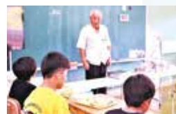
高原組合長あいさつ