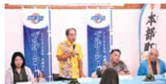
平良町長あいさつ

今後、カーブチーアイスが地域の特産品として広まり、多くの人々に親しまれることが期待されます。