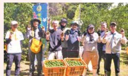
農家さんとウエルネスフーズの皆さん

シークワサー農家の方は「今後は小学生・中学生・高校生に収穫体験と商品を作る過程を見てもらい、本部町にはこういう産業があり商品があることを知ってもらいたい。また、高齢化が進んでいる中、今回の取り組みは農家・地域への貢献度が高い」と語っていました。