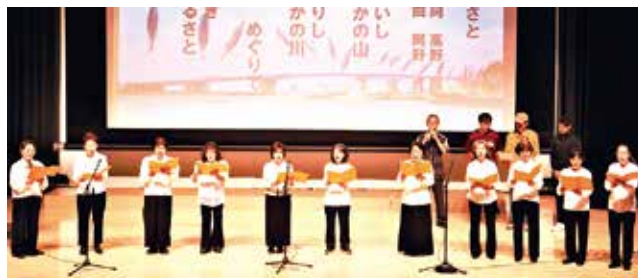
童話サークル ムジカ・カンタービレ