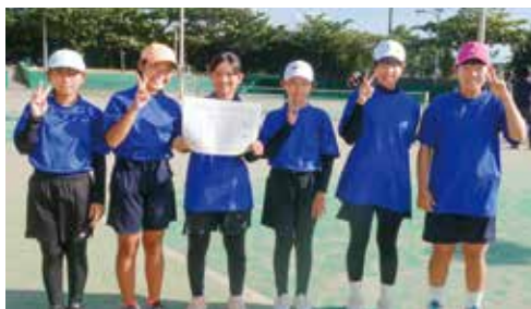
本部中学校 女子ソフトテニス部 第42回新報杯北部地区中学校ソフトテニス大会