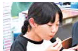
カーブチーアイス試食

組合長はおいしそうに食べていた地元の子どもたちにどういったことを知ってほしいかと質問すると、「地産地消を知ってもらいたい。また、みかん農家にも興味を持っていたらいい」と語っていました。カーブチーは運動会などでよく食べられていたが今後はカーブチーやカーブチーの皮を使用しての新商品の開発に協力していくと述べられました。