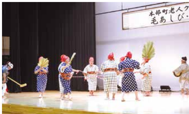
大東山老人クラブの「稲しり節」

大会には11団体が出場し、令和踊りや渡久地エイサー、稲しり節など、多彩な舞踊が披露されました。審査の結果、大東山老人クラブの「稲しり節」が代表に選ばれ、10月10日（金）に名護市で開催される北部地区老人芸能大会への出場が決定しました。