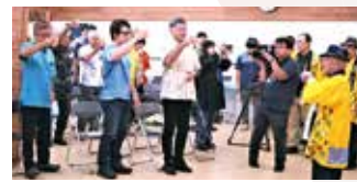
カーブチージュースで乾杯