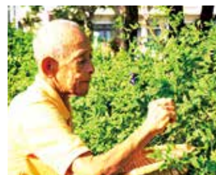
老人会の収穫作業