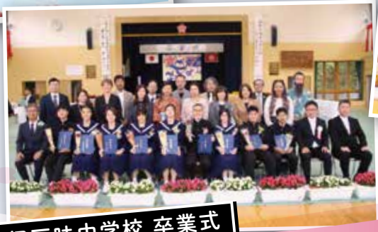
伊豆味中学校 卒業式