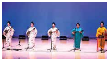
本部マークニー保存会