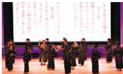
渡久地区シニグ保存会