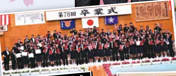
本部中学校 卒業式