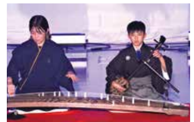
若衆舞台祭受賞者独唱