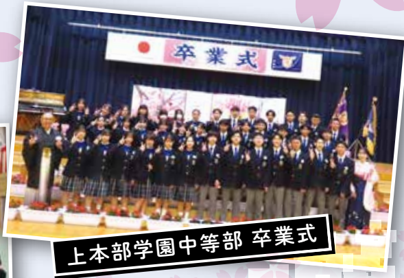
上本部学園中等部 卒業式